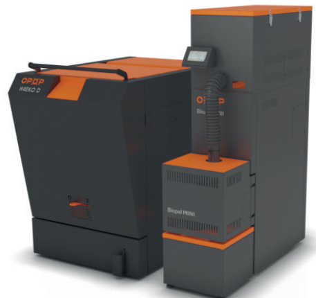
BIOPEL MINI KOMBI TOWER CA

Set BIOPEL MINI KOMBI spojuje všechny výhody peletového kotle BIOPEL MINI a zplynovacího kotle na dřevo H4EKO D. Řídící jednotka je umístěna v horní části BIOPELU MINI a řídí vytápění peletami i kusovým dřevem.